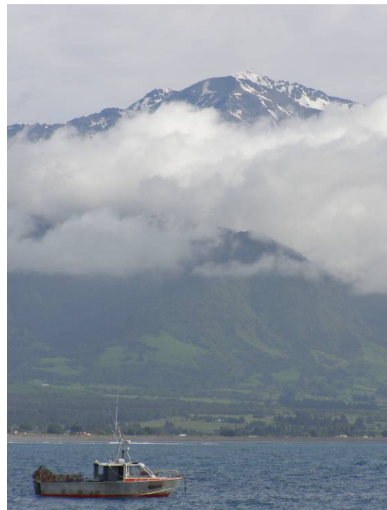
Nueva Zelanda, como muchos otros países es un paisaje bajo la presión del desarrollo.

La Carta del Paisaje del NZILA presentará la posición del Instituto sobre temas relacionados con el manejo y el cambio del paisaje, defendiendo el uso y el manejo inteligente de los paisajes de Nueva Zelanda. El NZILA está guiando el asesoramiento al gobierno de Nueva Zelanda y a quienes manejan nuestros paisajes en el uso y el manejo apropiado de uno de nuestros recursos más reconocidos.