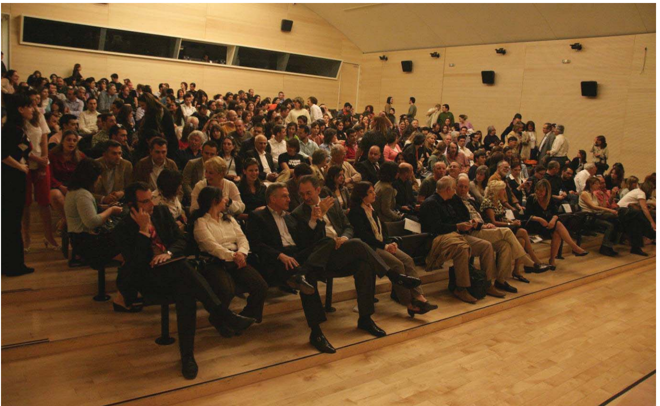
“...el anfiteatro para 500 personas estaba lleno y aún había gente parada en el auditorio”

Sin lugar a dudas este fue el evento más importante y, ciertamente, un hito en la presentación de proyectos de arquitectura del paisaje de alto estándar de diseño para el público griego. Esto ha iniciado un proceso educativo que la PHALA intenta desarrollar con una serie de conferencias de arquitectos paisajistas internacionales para estimular la profesión e informar al público y al sector privado.