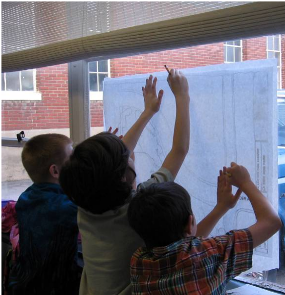
Un ejercicio corporativo: trazando el plano de sitio para el parque para perros de la ciudad de Coeur d'Alene