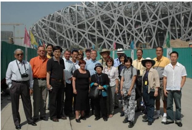
Delegados IFLA afuera del Estadio Nacional Bird's Nest

El parque, de 680 has, es el más grande de la ciudad. Contribuirá a la sostenibilidad y es un recurso en desarrollo para la misma. El masivo "pulmón verde" ayuda a combatir el impacto humano sobre el clima de Beijing. Se puede apreciar el beneficio económico para el público en la nueva calidad del medio ambiente que será importante para los atletas de la Villa Olímpica y ameno para la vida diaria de los residentes locales, en el futuro. Los arquitectos paisajistas han jugado un rol preponderante en todos los aspectos del proyecto. El Parque Forestal educa a las personas de todas las edades al permitirles entender a las plantas como parte de la naturaleza, al contexto cultural y a la tecnología ecológica, al acopio de agua, al re uso del agua de lluvia y al ahorro de energía. Como jardín construido para los Juegos Olímpicos, será sede de eventos tales como el tenis, la arquería y el hockey. Durante los Juegos recibirá, a diario, a más de 40.000 visitantes. El Parque se está desarrollando como una extensión natural de la ciudad, como una simbólica "vuelta a la naturaleza."