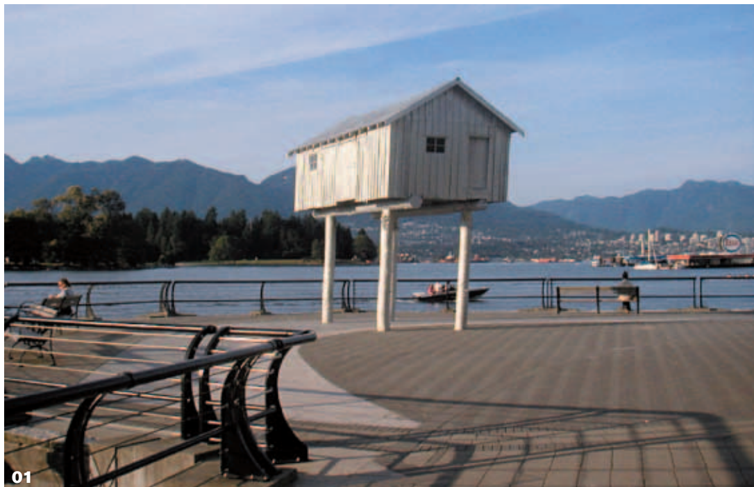
01 Mirador hacia la orilla norte y Burrard Inlet

La imagen de la ciudad central y algunos edificios emblemáticos, especial-